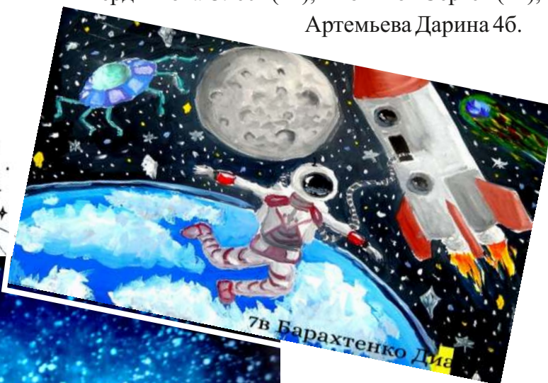
7в Барахтенко Дия