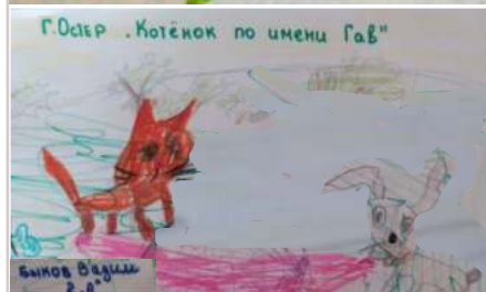
Г.Остер «Котёнок по имени Гав»

Прочитал книгу – нарисуй главного героя, понравилось описание природы – дорисуй полянку.