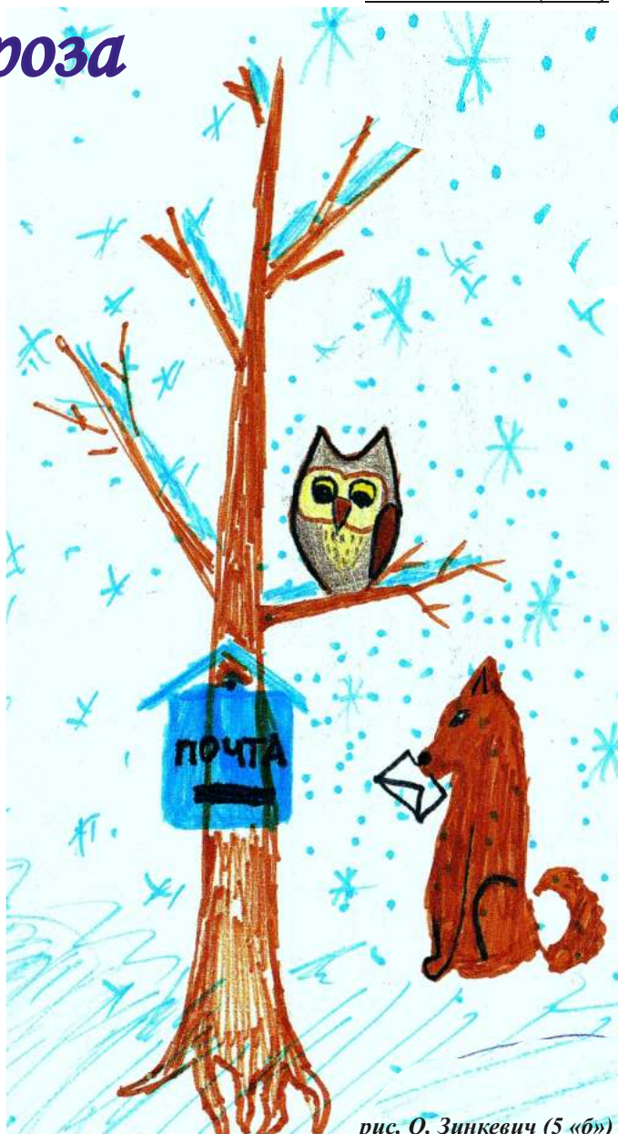
рис. О. Зинкевич (5 «б»)