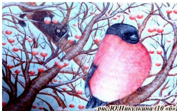
рис.Ю.Никулкина (10 «б»)