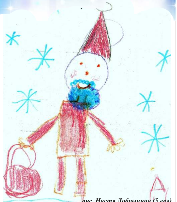
рис. Настя Добрынина (5 «в»)