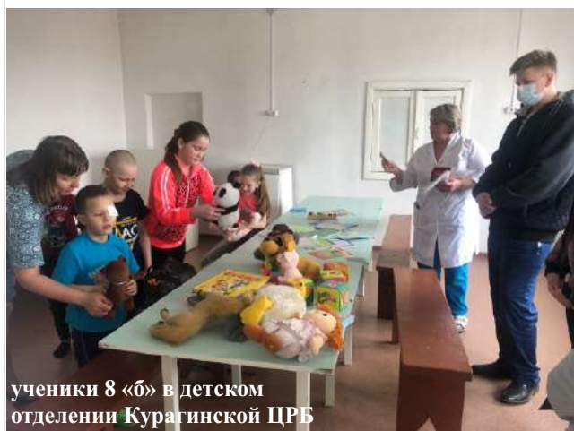
ученики 8 «б» в детском отделении Курагинской ЦРБ

В нашей школе проходит акция. Фотографии и новости об участии в ней можно посмотреть и добавить на https://vk.com/public203690956 Каждое доброе дело приносит пользу не только тому, кому «делает добро», но также тому, кто совершил такой хороший поступок. Присоединяйтесь !