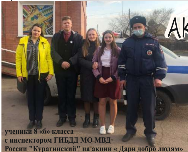
ученики 8 «б» класса с инспектором ГИБДД МО МВД России "Курагинский" на акции « Дари добро людям»

Добрые поступки – естественная потребность любого человека. Без них невозможно настроиться позитивно на жизнь.