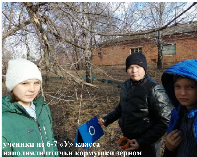
ученики из 6-7 «У» класса наполняли птичьи кормушки зерном