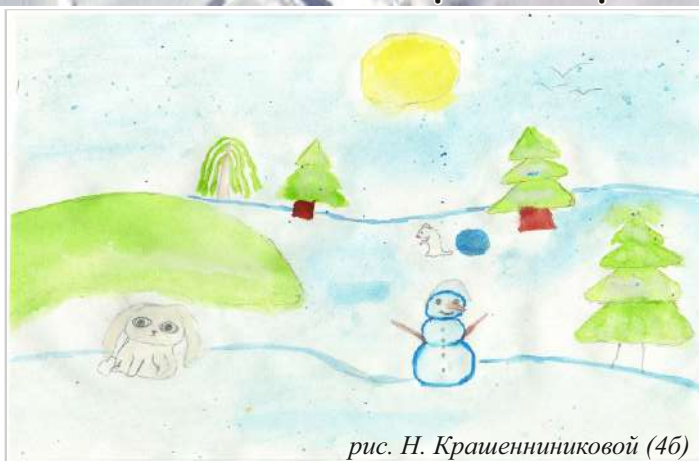
рис. Н. Крашениниковой (4б)