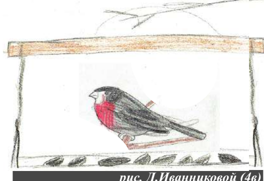
рис. Д.Иванниковой (4в)

Становится очень холодно и морозно на улице. Птицам трудно добывать пищу. Я вместе со своим дядей сделал из фанеры кормушку. Она получилась красивая и очень удобная. Сверху снег не засыпает, птицам удобно сидеть. Насыпал зерна и стал ждать, что будет дальше. Прилетели птицы, стали клевать пищу и щебетать, как будто радовались и говорили нам: «Спасибо». Я с большим удовольствием наблюдал за ними. Мне стало очень радостно, что я помогаю птицам.