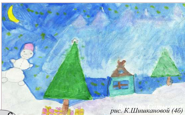
рис. К. Шишкановой (4б)